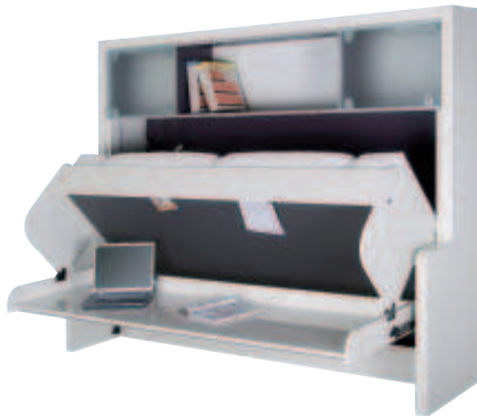
Parallelverschiebung der Arbeitsplatte nach unten bzw. oben