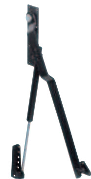
Beschlag für eine Seite